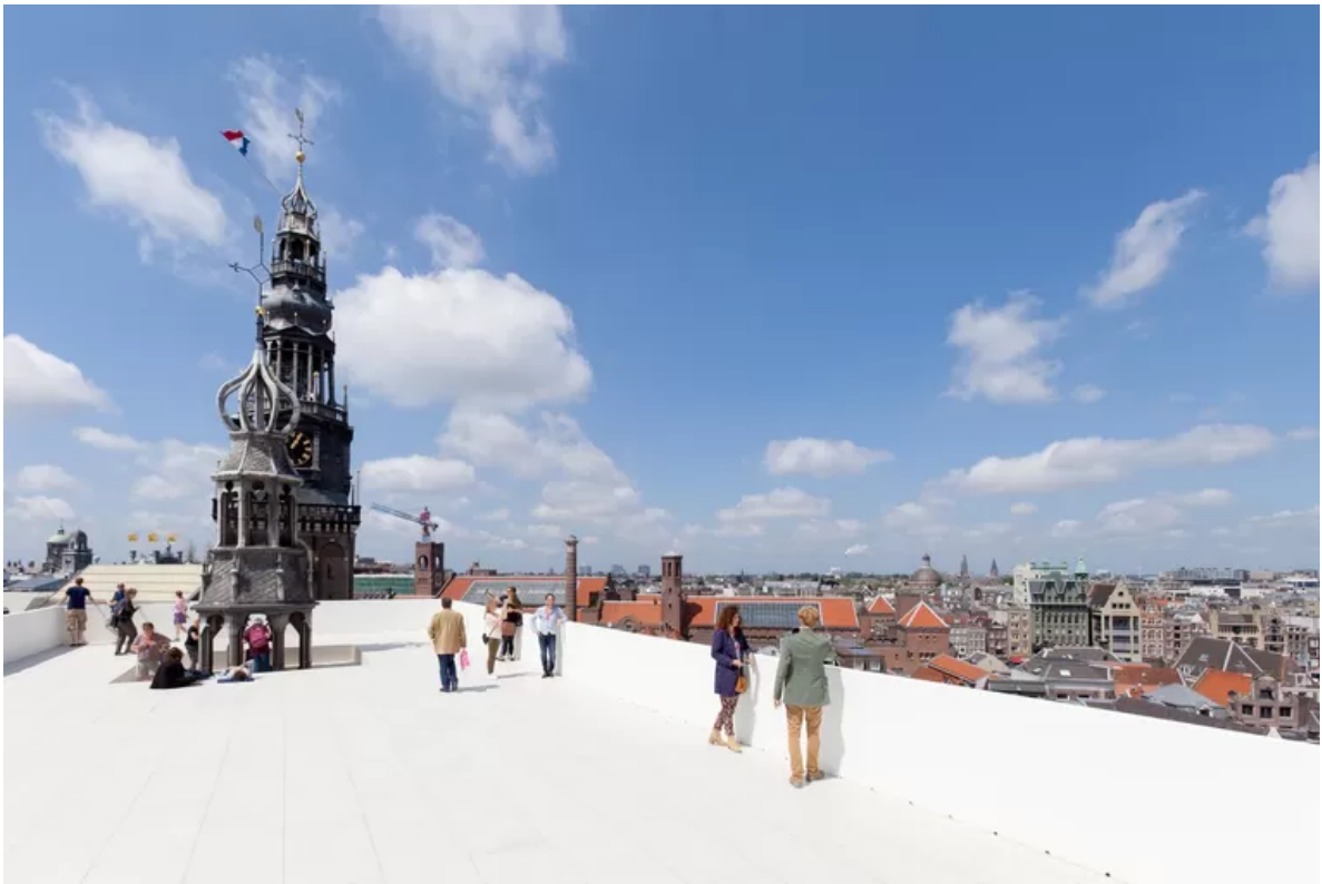
The Garden Which is The Nearest to God van Taturu Atzu